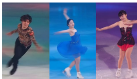
真凜と望結がアイスショー 2人そろってインタビューに