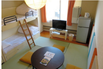
エンゼルリゾート湯沢で民泊に使われているワンルーム。5人まで泊まれる