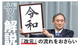
平成から令和へ「改元」儀式などの流れ、動画で解説