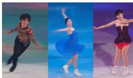
真凜と望結がアイスショー 2人そろってインタビューに