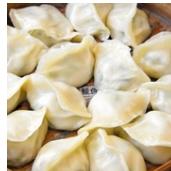
中国でも珍しいギョーザ