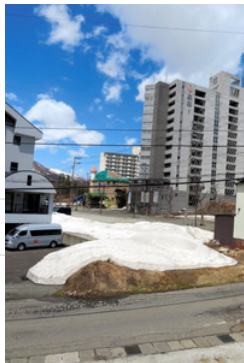
マンション苗場が立っていた敷地(中央の空地)。右奥は運営会社が経営破綻(はたん)した会員制リゾートホテル＝新潟県湯沢町三國、4月15日