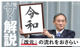
平成から令和へ「改元」儀式などの流れ、動画で解説